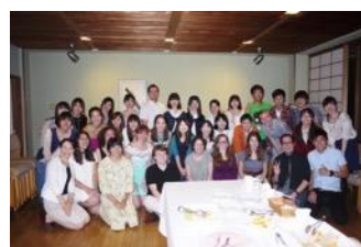
カールトンからの留学生との交流写真

本プログラムは8月上旬から下旬の3週間にかけて米国ミネソタ州のカールトン大学（Carleton College）において行われるサマープログラムですが、夏期のみならず渡航前の春学期から同志社大学においてカールトン大学の学生と交流が始まります。カールトン大学現地での語学研修で英語運用能力を向上させるだけでなく、同志社とカールトンの両大学における学生同士の交流から、